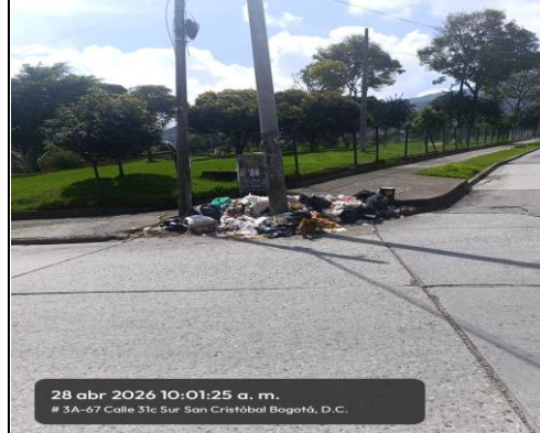
FOTOGRAFIA 2. PUNTO CRÍTICO #1 CAR 4 ESTE # 31a-71