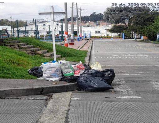
FOTOGRAFIA 5. PUNTO CRÍTICO #4