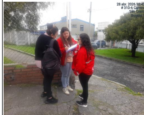
FOTOGRAFIA 6. CONTINUAMOS

Nota: Agregue o elimine las filas que sean necesarias para registrar los asistentes y los compromisos de la reunión.