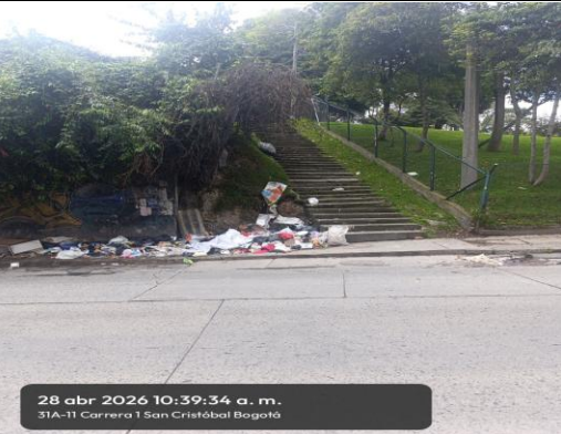
FOTOGRAFIA 3: PUNTO CRÍTICO #2 CAR 4 ESTE #31A - 05