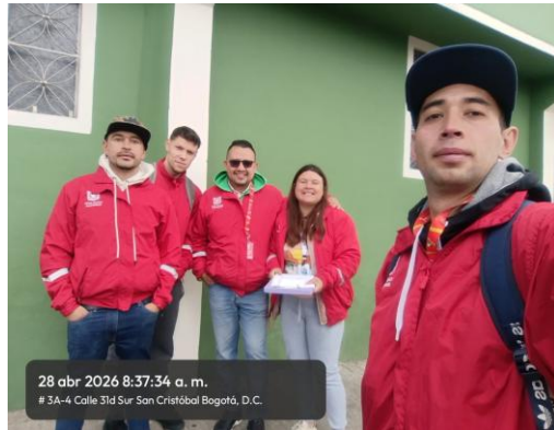
FOTOGRAFIA 1. INICIO SENSIBILIZACIÓN

Se evidencia presencia de plaga de roedores en punto crítico carrera 4 este # 31 a- 05 esquina de las escaleras del parque Columnas.