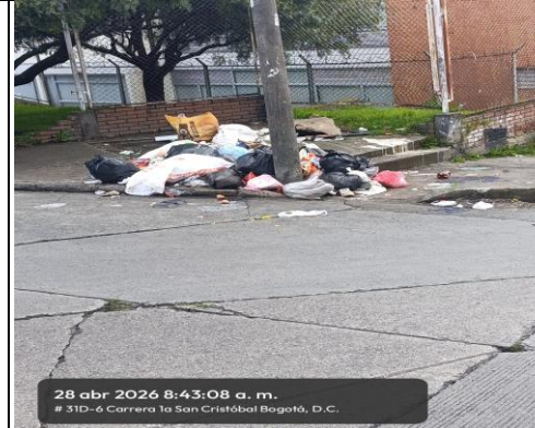
FOTOGRAFIA 4. PUNTO CRÍTICO # 3 CAR 3 A ESTE # 31 B SUR